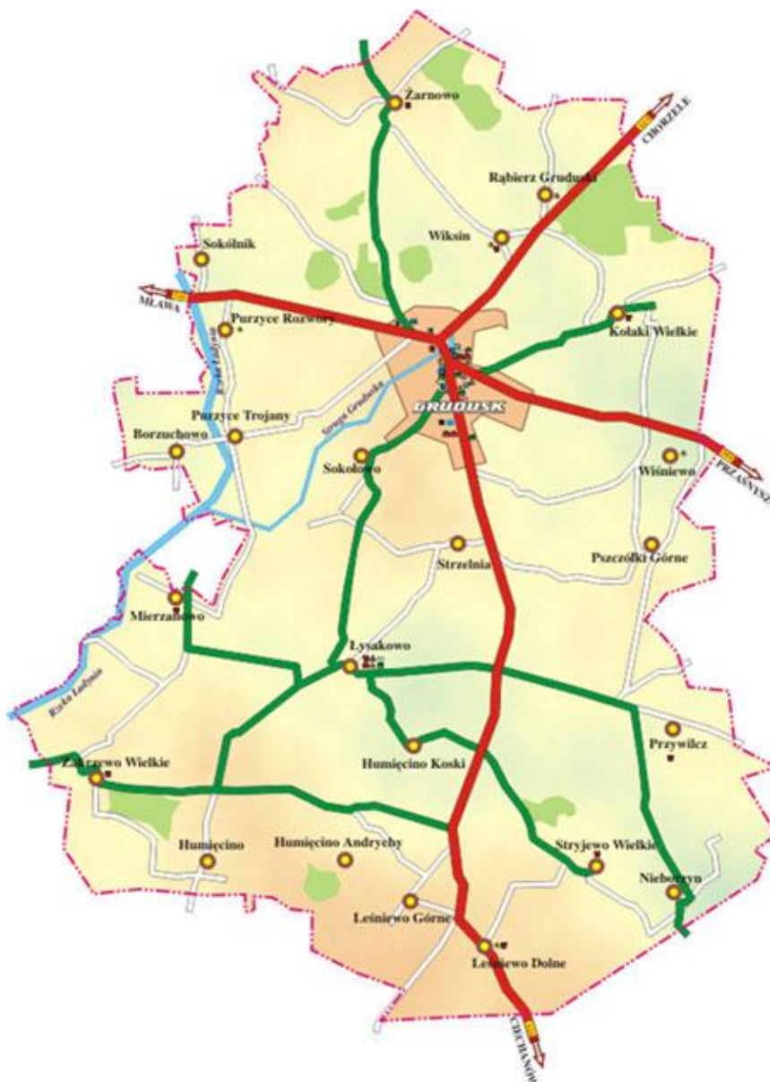
Mapa Gminy Grudusk